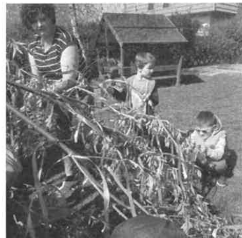
SZERETJÜK A LÁNYOKAT