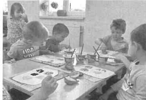
KÉSZÜLNEK A ZÖLDSÉG LENYOMATOK