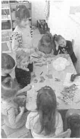
HÚSVÉTI NYUSZIK KÉSZÍTÉSE