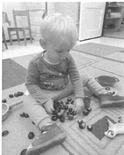
Játék a termésekkel

Ősszel megismerkedünk a színekkel, leveleket gyűjtünk, préselünk, festünk, gesztenyét sze- dünk.