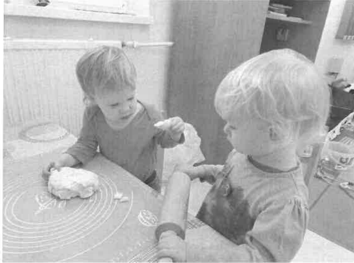
Só-liszt gyurma, karácsonyi aján- dék készítés

Sajópálfala Község Önkormányzata 3714 Sajópálfala, Szabadság u. 26. Tel: + 36 46/ 327-482 e-mail: onkormanyzat@sajopalfala.hu