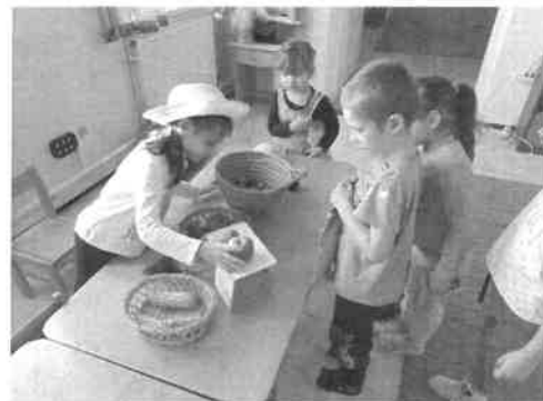
Mihály napi vásár