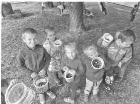
Gesztenyeszedés a templom kertben