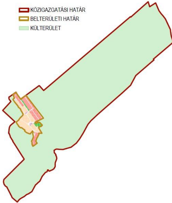
Teljes közigazgatási terület